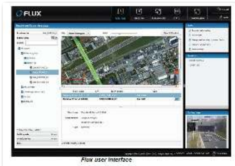
Gambar 24Tampilan Software Flux Management