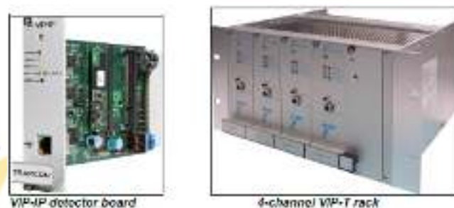
Gambar 23 VIP - IP

Papan VIP ditempatkan dalam rack system yang berdiri sendiri atau ditempatkan dalam satu box rack system untuk kepentingan yang berbeda. Semua VIP boards interface menggunakan IP dengan central management software sebagai tempat menyimpannya, memvisualisasikan dan melaporkan semua kejadian dan data ke operator atau pihak ketiga dari TMC.