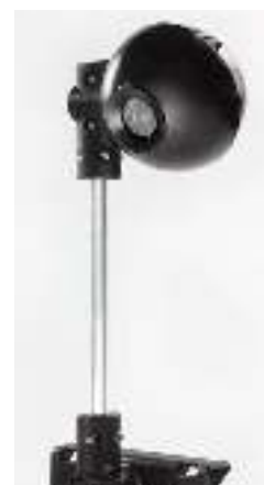
Gambar 21 Collect-R