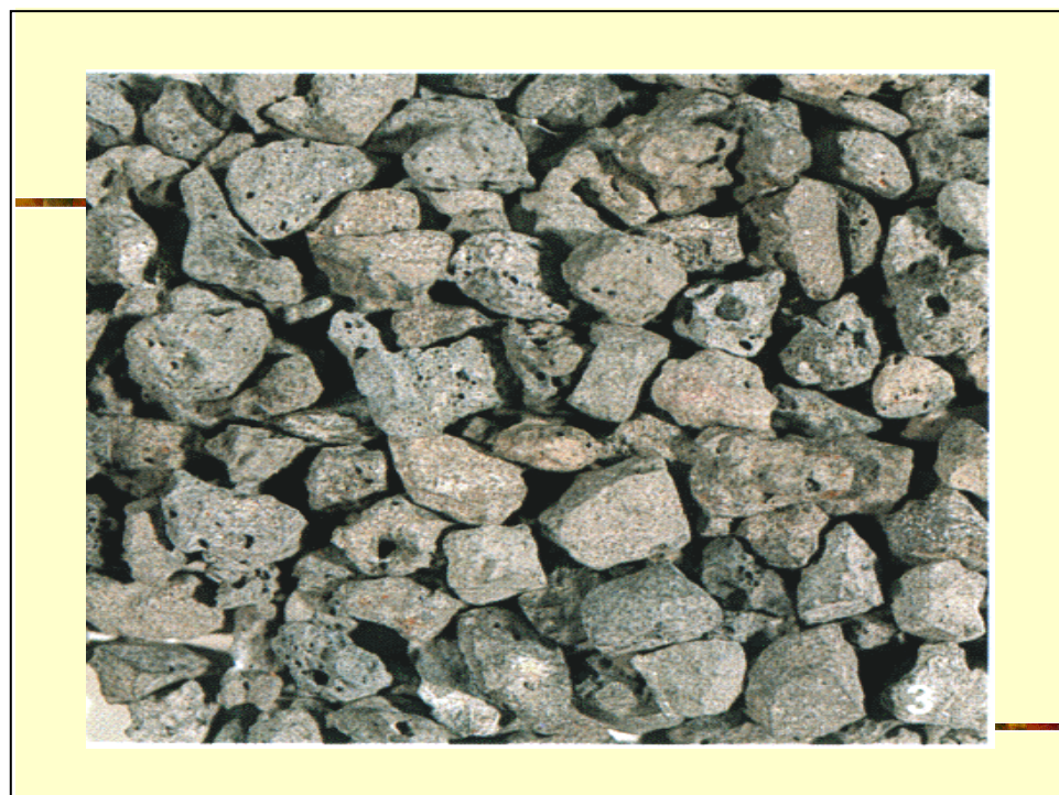
Gambar 2 Agregat slag