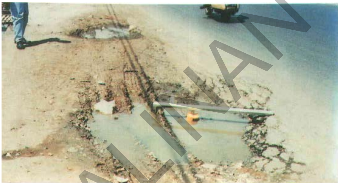
Gambar 23. Lubang/Penurunan Pada Trotoar Tidak Beraspal