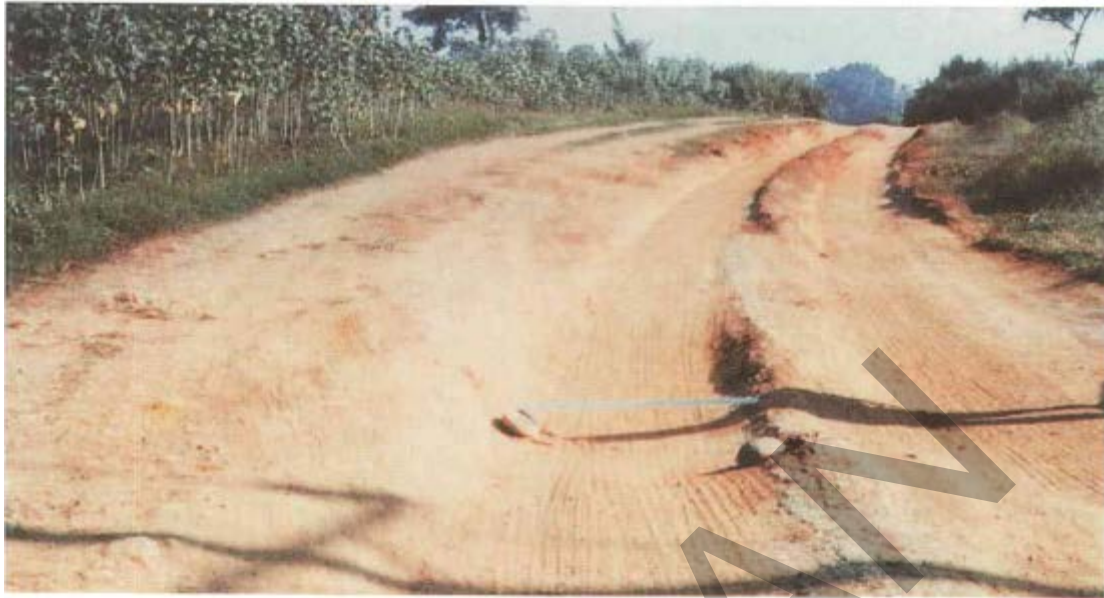
Gambar 6. Kerusakan Alur Pada Permukaan Jalan Tidak Beraspal