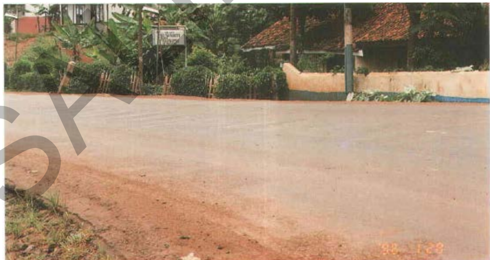
Gambar 3. Kerusakan Bergelombang/Keriting Pada Permukaan Jalan Beraspal