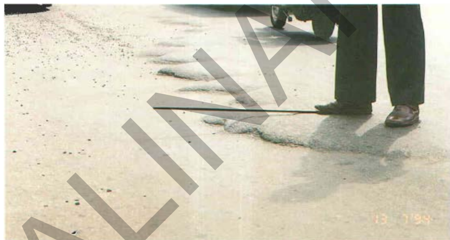
Gambar 9. Kerusakan Jembul Pada Permukaan Jalan Beraspal