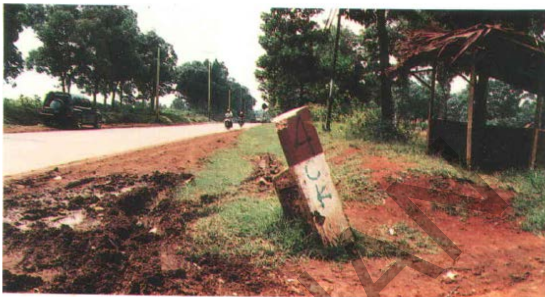
Gambar 37. Kerusakan Patok KM, HM.