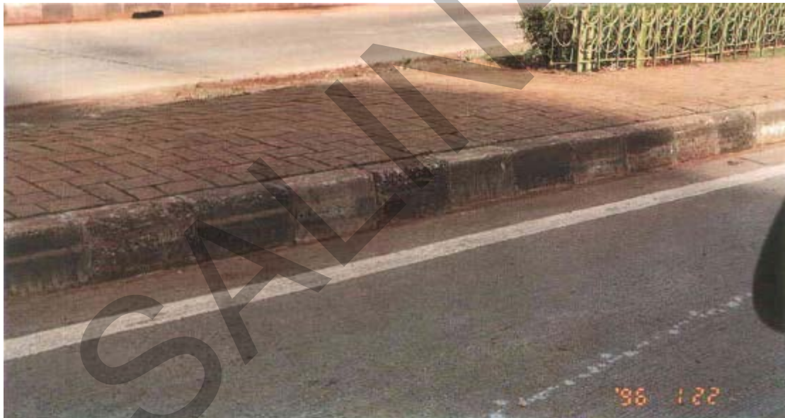
Gambar 28. Inlet Kereb yang Cacat