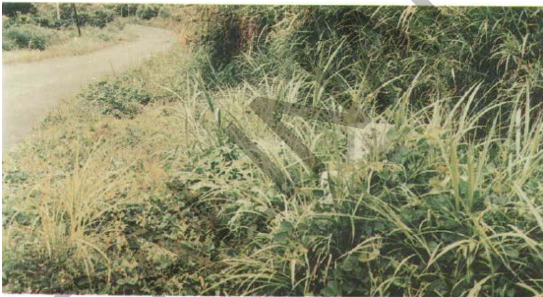
Gambar 39. Patok KM, HM Yang Terhalang.