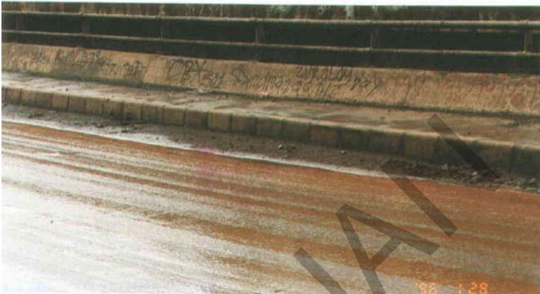
Gambar 56. Kotoran Pada Lantai Kendaraan.