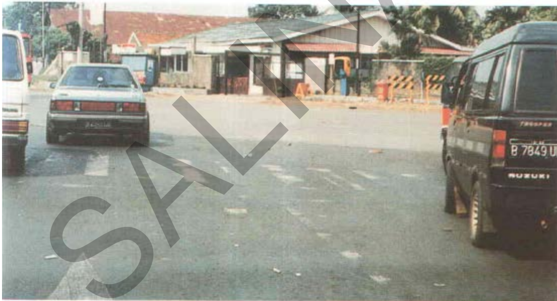
Gambar 45. Marka Jalan Yang Pudar