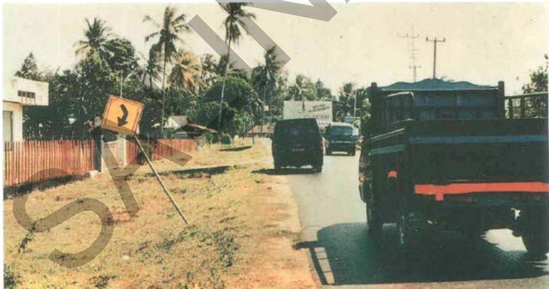
Gambar 40. Perubahan Letak Rambu Penunjuk Jalan