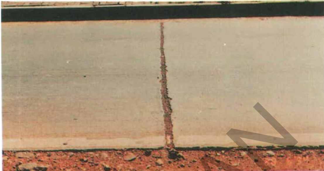
Gambar 16. Kerusakan Pengisi Celah Sambungan Perkerasan Kaku