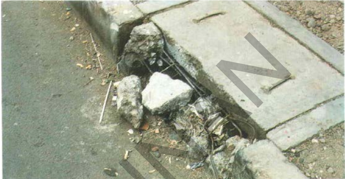
Gambar 26. Kerusakan Pada Inlet Kerek