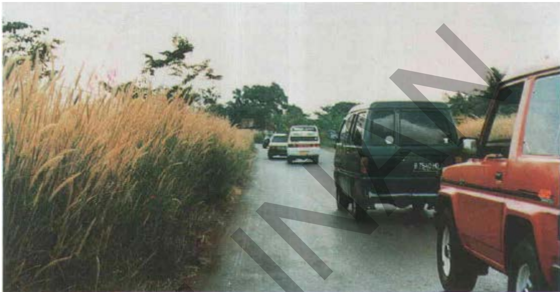
Gambar 21. Rumput yang Panjang Pada Perkersan Jalan Tidak Beraspal