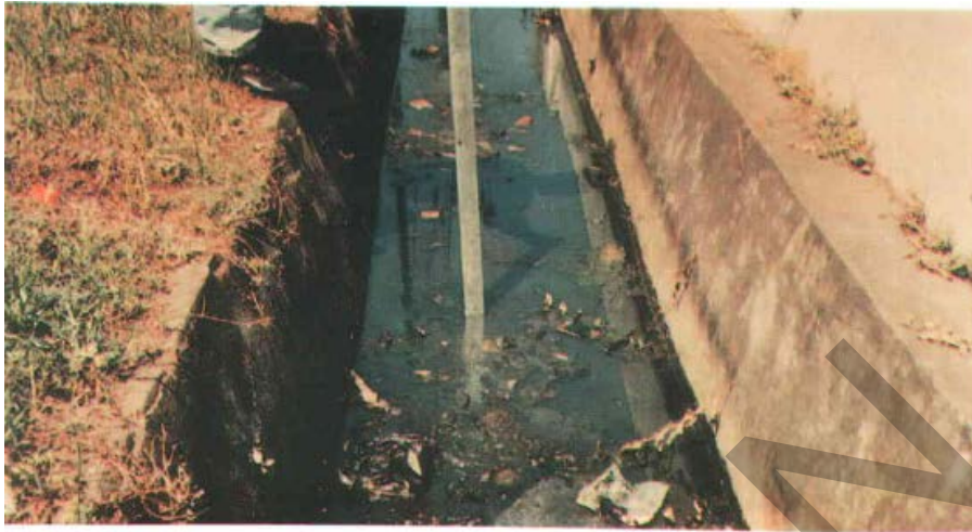
Gambar 29. Pendangkalan pada Drainase Saluran Terbuka