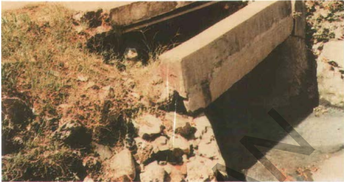
Gambar 34. Kerusakan Pada Kepala Gorong-Gorong