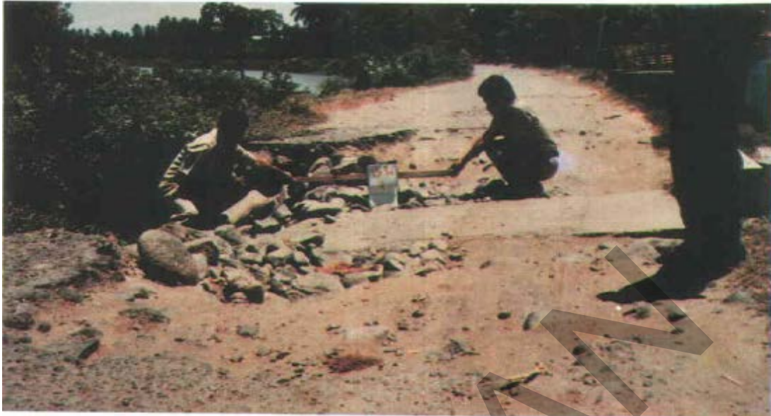
Gambar 33. Kerusakan Pada Gorong-Gorong