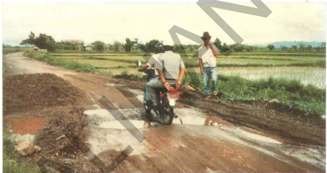
Gambar 2. Kerusakan Lubang Pada Permukaan Jalan Tidak Beraspal