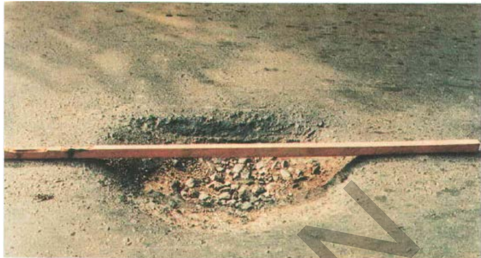
Gambar 1. Kerusakan Lubang Pada Permukaan Jalan Beraspal.