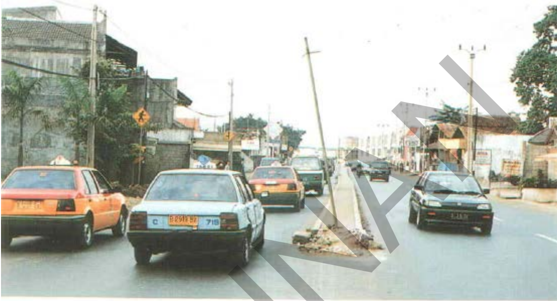
Gambar 43. Rambu Yang Hilang