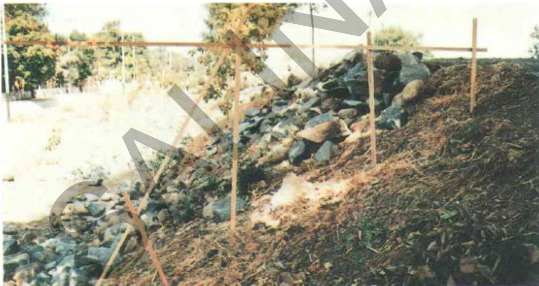
Gambar 52. Kehilangan Batu Pada Lereng