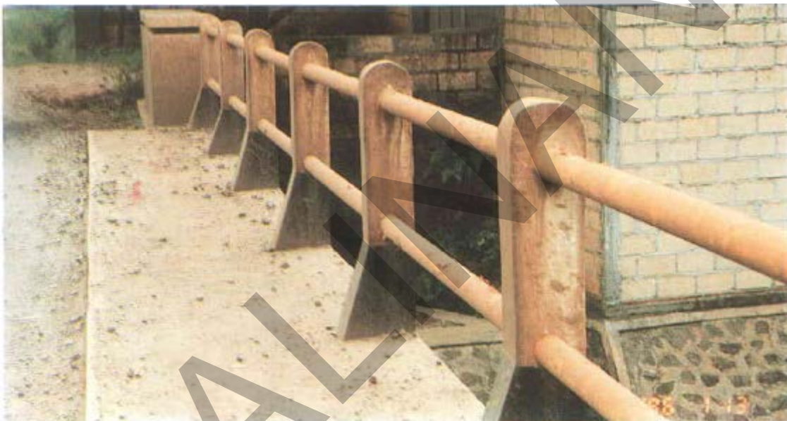
Gambar 57. Pagar/Railing yang Memudar