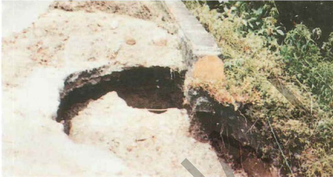
Gambar 55. Kerusakan Lapis Pondasi Jalan.