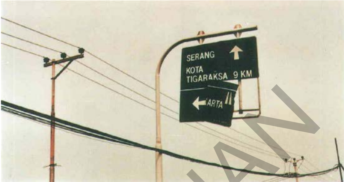
Gambar 42. Rambu Yang Rusak