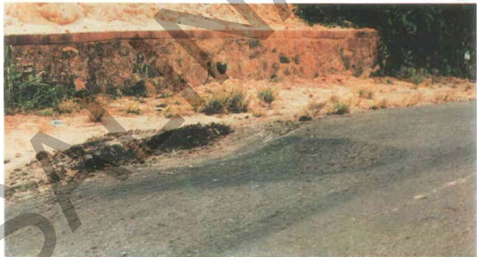
Gambar 7. Penurunan/Ambles Pada Permukaan Jalan Beraspal