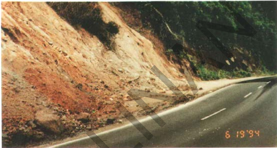
Gambar 48. Rembesan Air Pada Lereng.