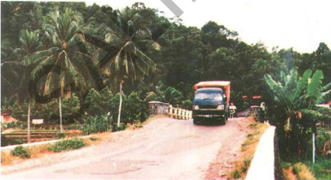
Gambar 58. Penurunan Oprit Jalan