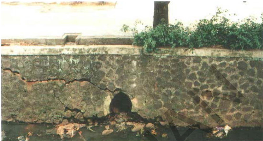
Gambar 50. Ambblas Pada Lereng Dengan Pasangan Batu.