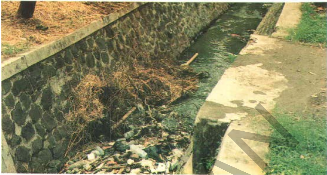
Gambar 35. Timbunan Sampah Pada Saluran.