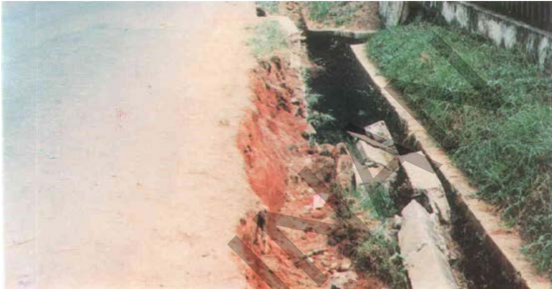
Gambar 30. Kerusakan Pada Saluran Terbuka