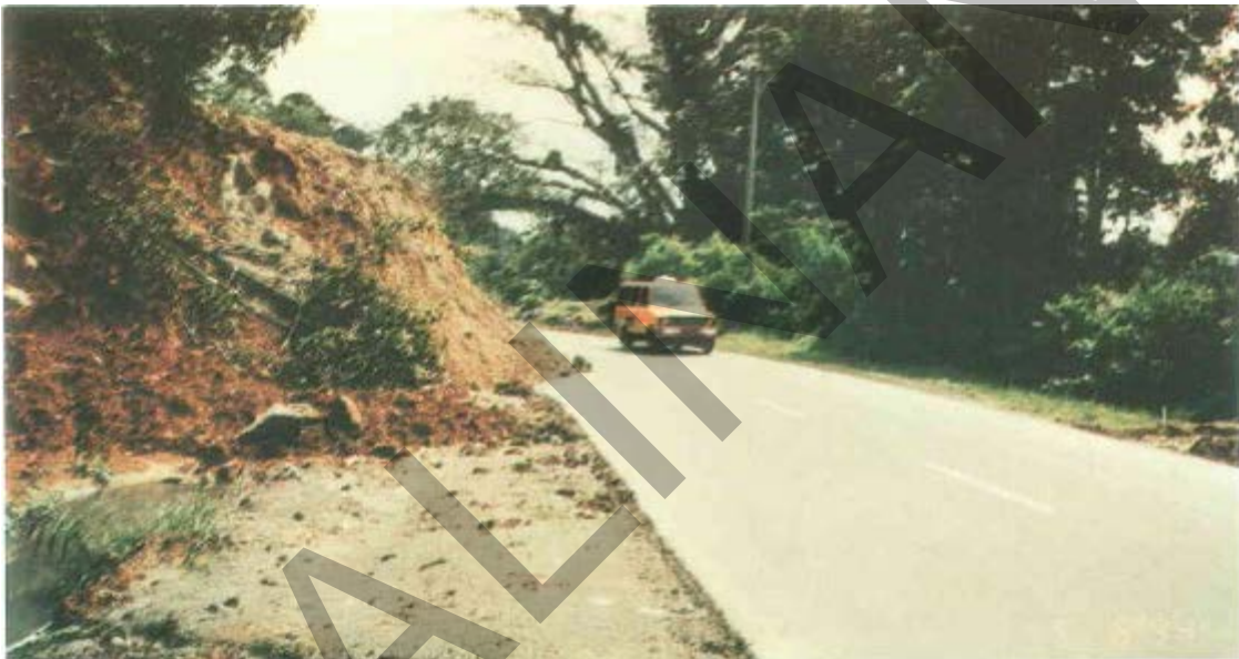
Gambar 53. Longsor Badan Jalan