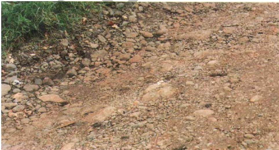
Gambar 15. Permukaan yang Tergerus Pada Permukaan Jalan Tidak Beraspal