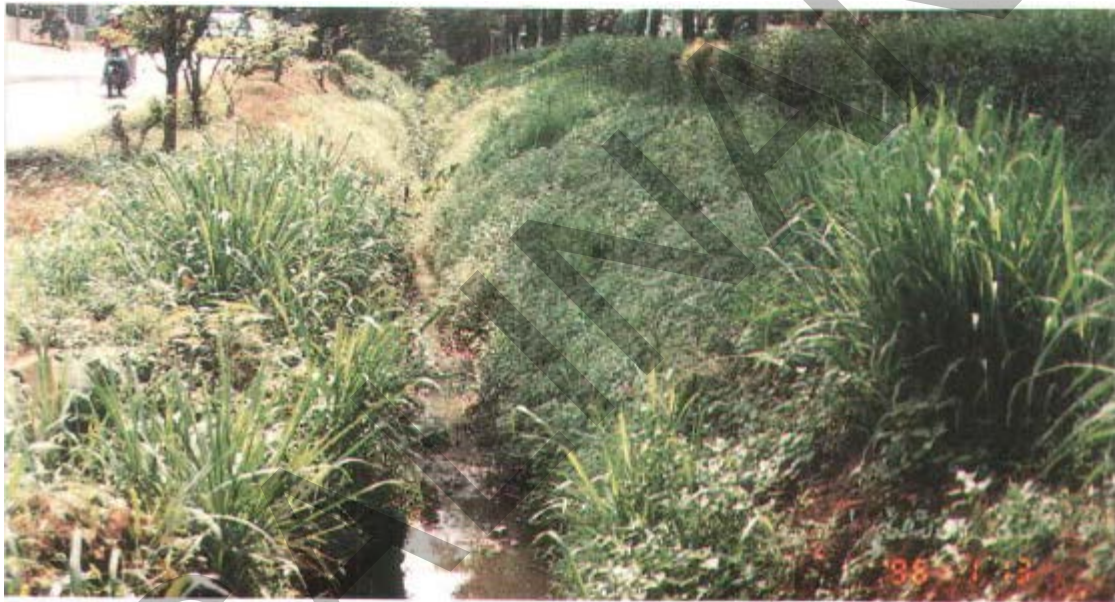
Gambar 31. Tumbuh-Tumbuhan Pada Saluran Terbuka