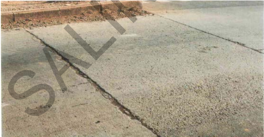
Gambar 18. Slab Pecah/Mengelupas Pada Sambungan Perkerasan Kaku