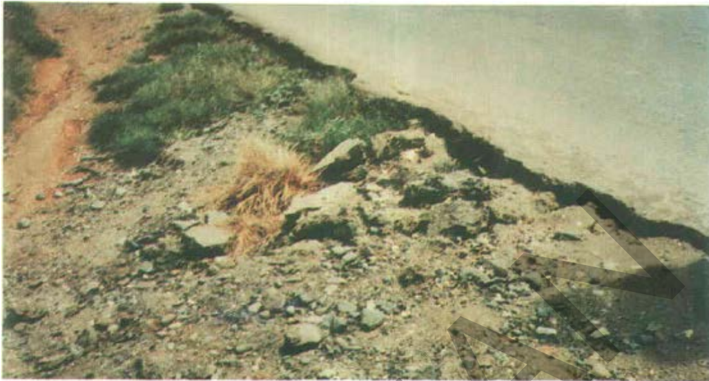
Gambar 47. Erosi atau Pengikisan Lereng Tanah