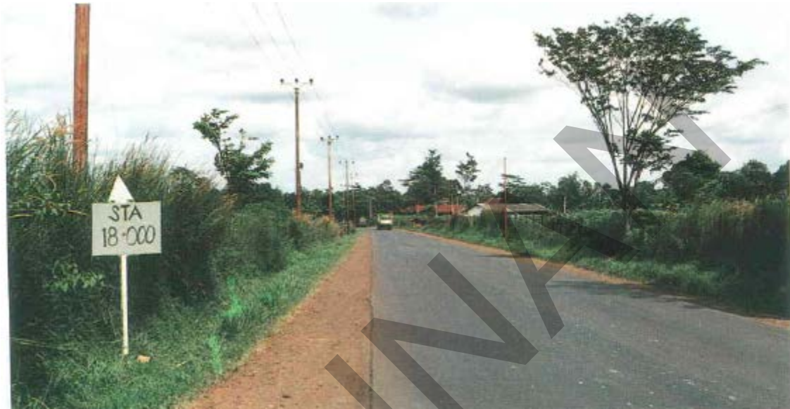
Gambar 38. Patok KM, HM Yang Hilang.