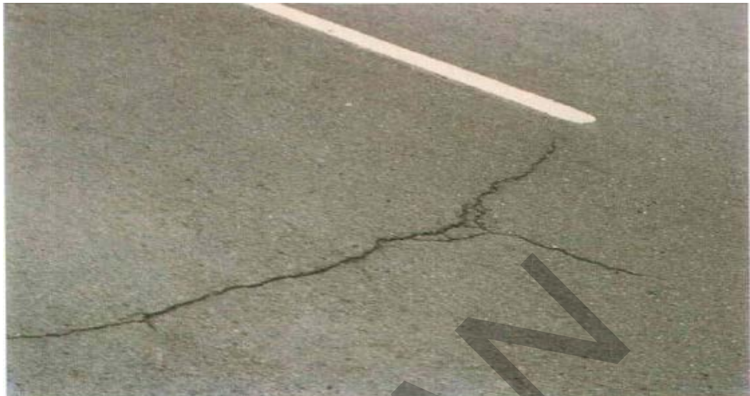
Gambar 12. Kerusakan Retak Garis Pada Permukaan Jalan Beraspal