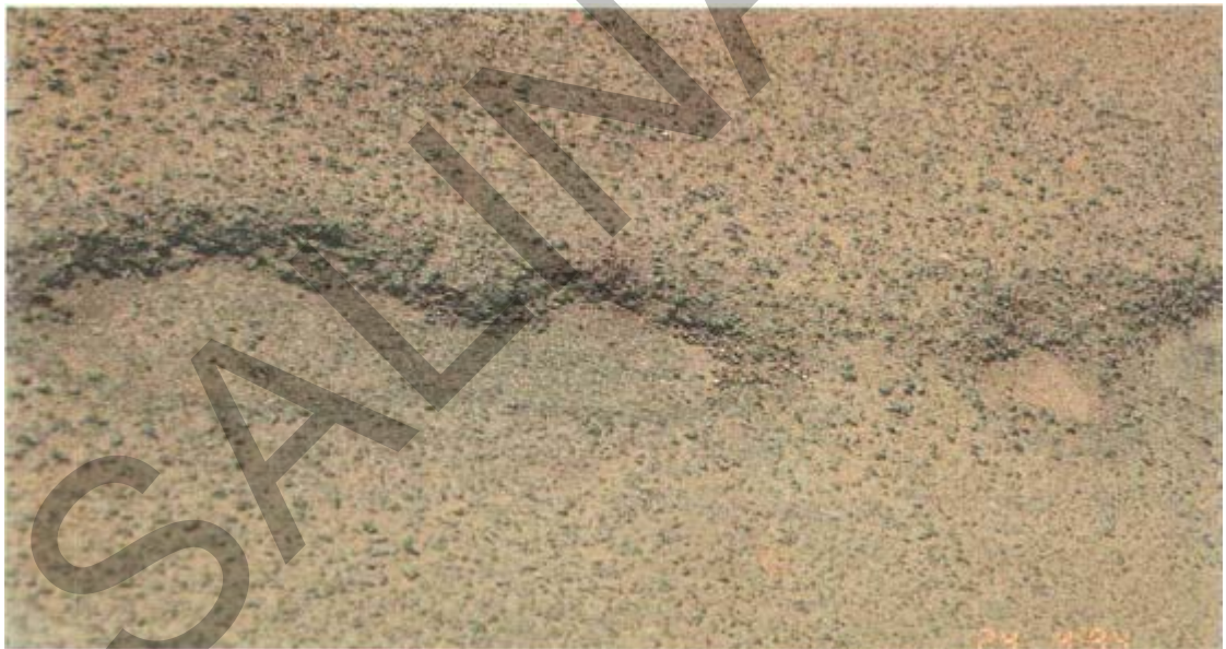
Gambar 14. Kerusakan Terkelupas Pada Permukaan Jalan Beraspal