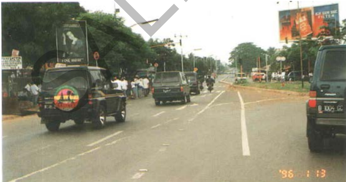
Gambar 46. Marka Jalan Yang Salah