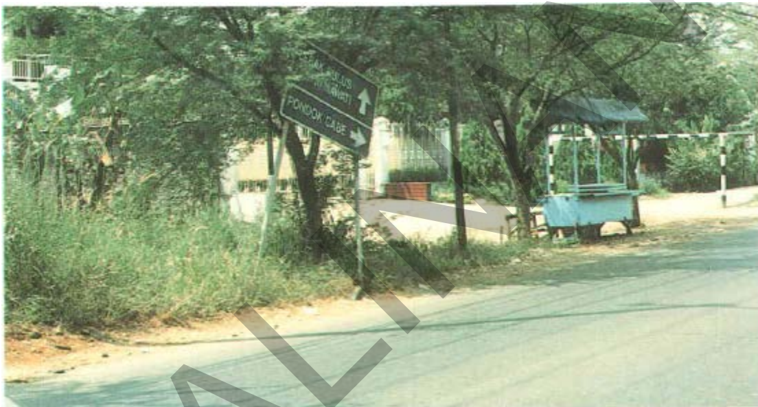
Gambar 44. Patok Yang Hilang Atau Rusak