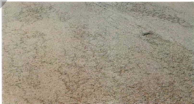
Gambar 11. Kerusakan Retak Buaya Pada Permukaan Jalan Beraspal