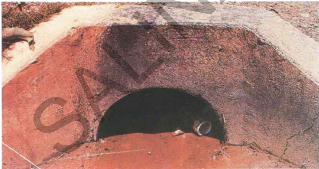
Gambar 32. Gorong-Gorong Yang Tersumbat