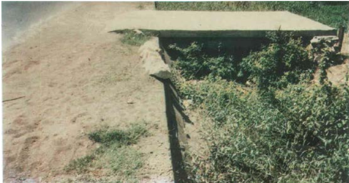
Gambar 20. Permukaan Lepas Pada Perkersan Jalan Tidak Beraspal