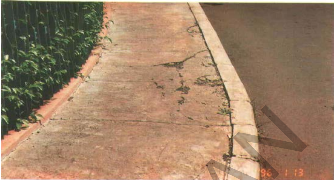
Gambar 25. Kerusakan Beton Pecah/Mengelupas Pada Trotoar dari Beton