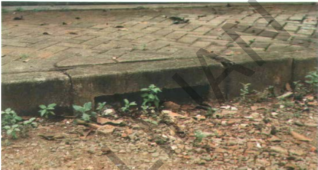
Gambar 27. Inlet Kerek Tersumbat