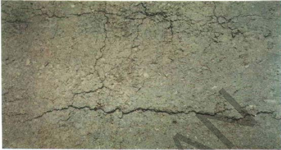
Gambar 22. Retak Pada Trotoar Beraspal