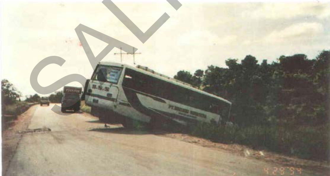
Gambar 54. Kecelakaan Lalulintas