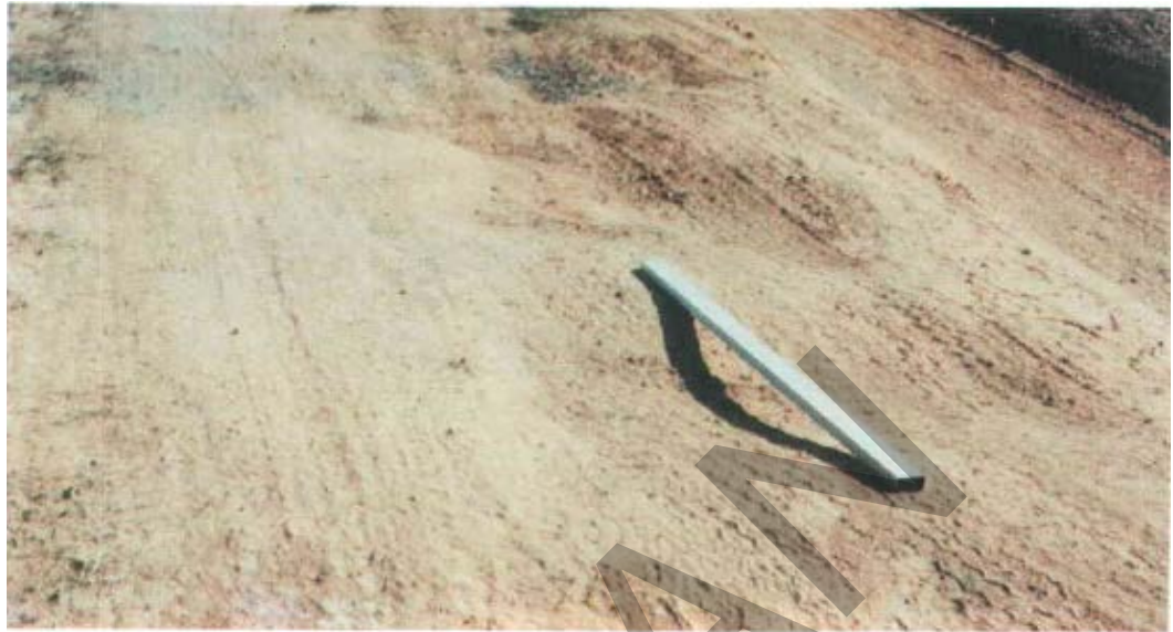
Gambar 4. Kerusakan Bergelombang/Keriting Pada Permukaan Jalan Tidak Beraspal