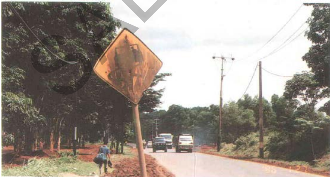
Gambar 41. Rambu Yang Kotor