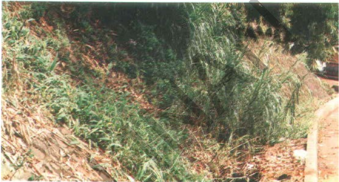
Gambar 51. Rumput Panjang Pada Lereng