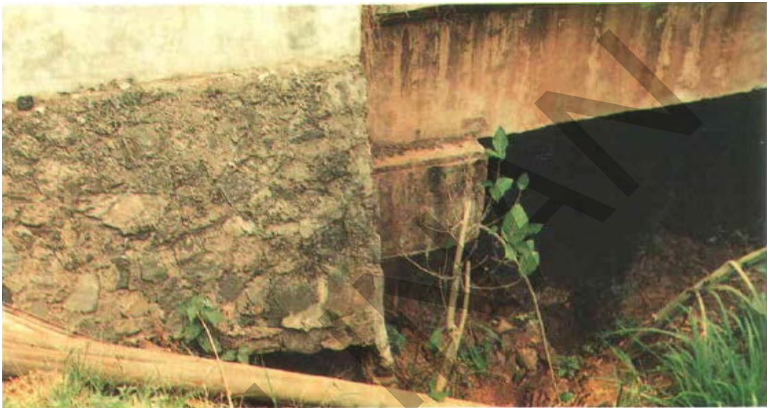
Gambar 36. Penggerusan Pada Saluran.