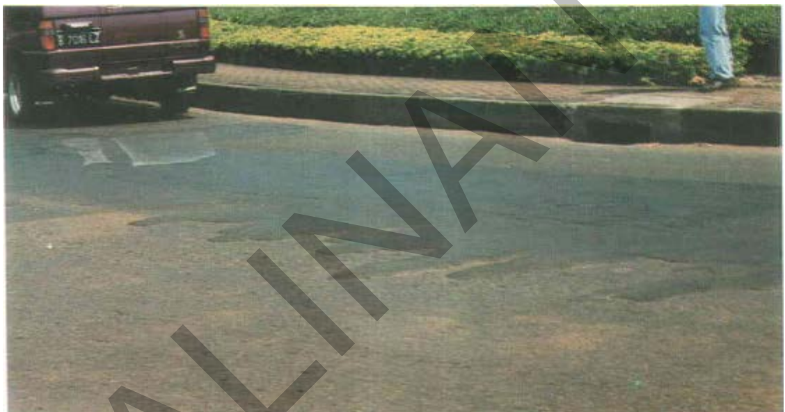
Gambar 13. Kegemukan Aspal Pada Permukaan Jalan Beraspal