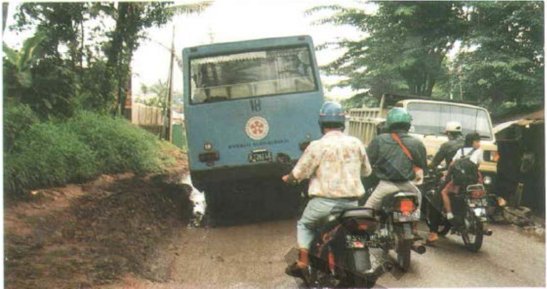
Gambar 8. Penurunan/Ambles Pada Permukaan Tidak Jalan Beraspal