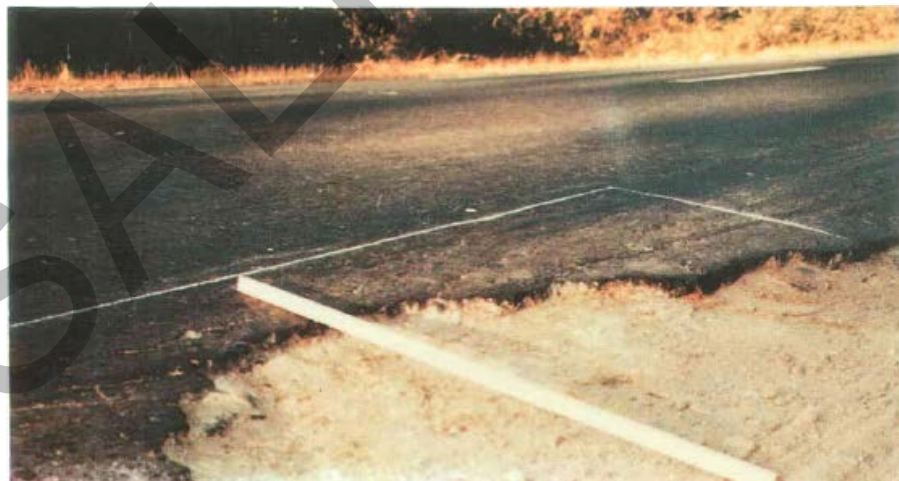
Gambar 10. Kerusakan Tepi Pada Permukaan Jalan Beraspal