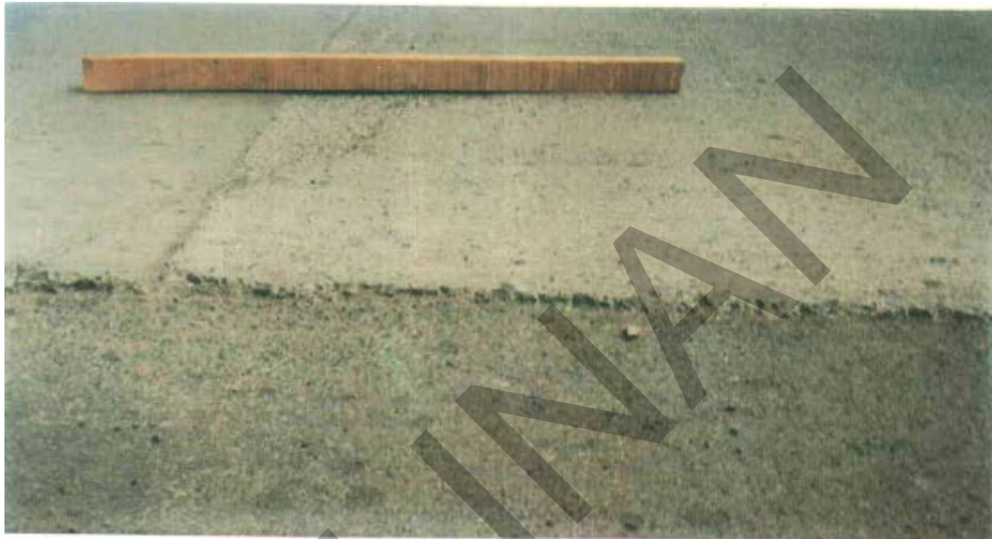
Gambar 17. Penurunan Slab Pada Sambungan Perkerasan Kaku