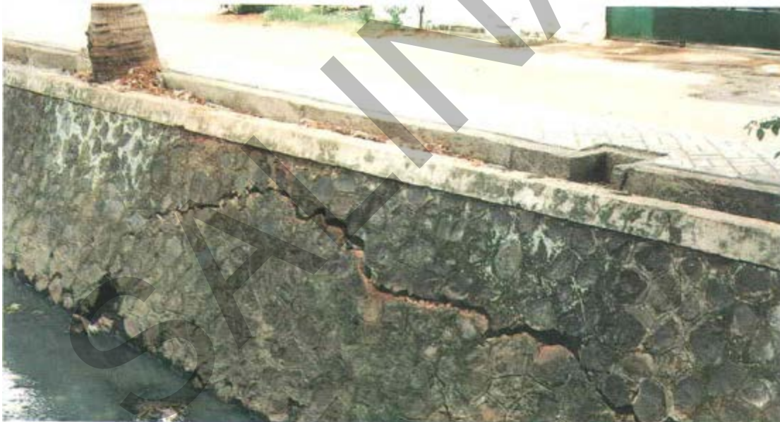
Gambar 49. Retak Pada Lereng Dengan Pasangan Batu.