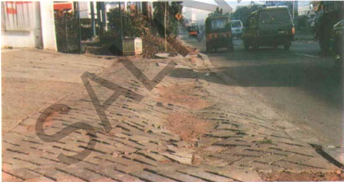
Gambar 24. Perbedaan Ketinggian Pada Trotoar dari Blok Terkunci